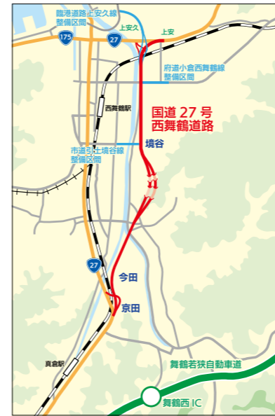
▲西舞鶴道路の位置図