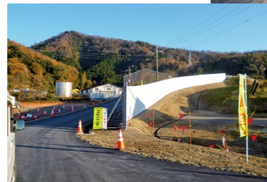
▲工事用進入路工事 (左右とも、境谷)