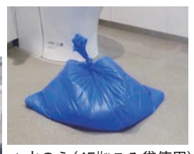
▲水のう（45%こみ袋使用）