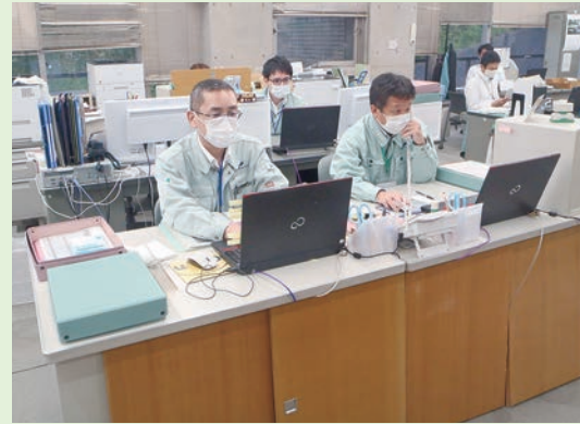
▲カウンターに向かいお客さまをお迎え

4月1日に業務を開始し、皆さまに支えられ無事今日を迎えています。市民サービスの向上と安定した上下水道事業運営のため、弊社の培ってきた経験と技術、民間企業ならではの発想、そして熱意と誠意をもって取り組んでまいります。 (株)フューチャーイン