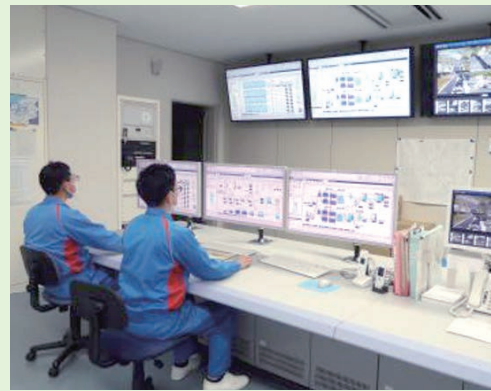
▲モニターを見ながら監視

突発的な機器異常、水質変動に備えて24時間監視を行っています。大雨で河川が増水した時は、水質が大きく変動するため、細心の注意を払い、水道施設の運転管理を行っています。市内に150か所以上の施設があり、さまざまな機器があります。各機器メーカーと連携し、日々のメンテナンスや機器の故障対応を行い、安全安心な水道水の供給に努めていきます。