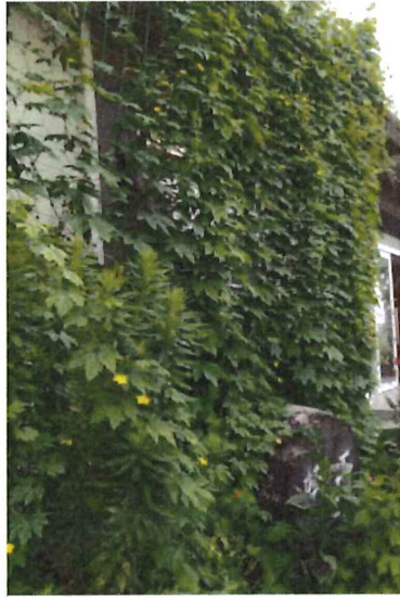
大きく育ち、実ができ始めました。 （ゴーヤ）