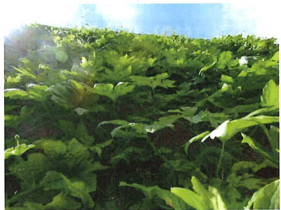
立派なゴーヤのカーテンができました！