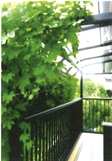
ネットからはみ出して葉が広がりました。