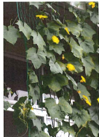
日かげになった校長室。 （ヘチマ）