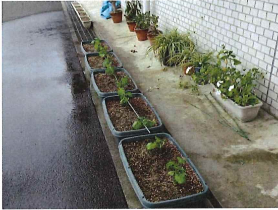
5月15日、加佐のゴーヤ苗植え付けました！