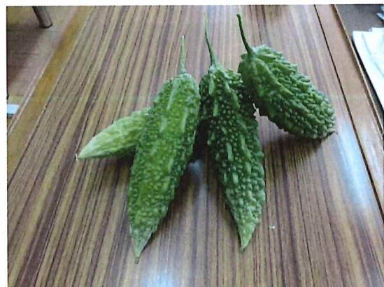
ゴーヤがたくさん収穫できました。