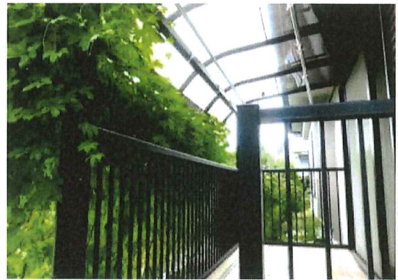
南からの日差しを和らげます。