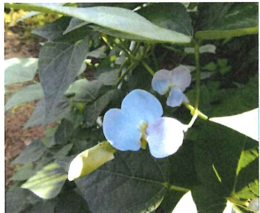
シカク豆の花で、癒し系の薄紫の花が咲きました。豆の収穫も楽しみにしています。