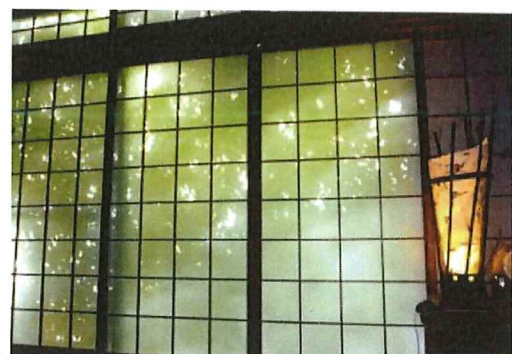
障子越しに見る景色は幻想的な風景が現れます。