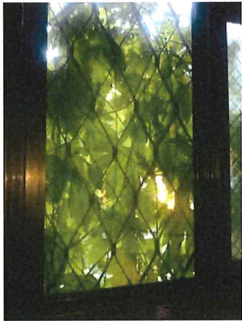
洗面所から撮影。家の中もカーテン効果で涼しいです。目にも優しく、リラックス効果もあります。