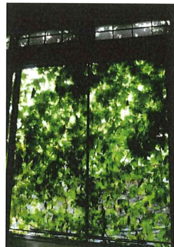
温度は測ったことはないが、エアコン設定温度は上がっています。