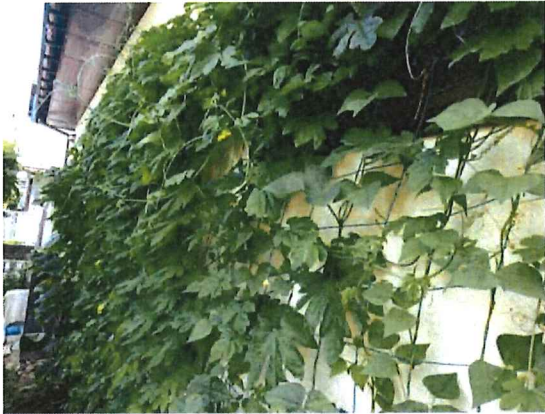
手前がシカク豆、中にバタフライピー、奥にゴーヤとキュウリを植えました。