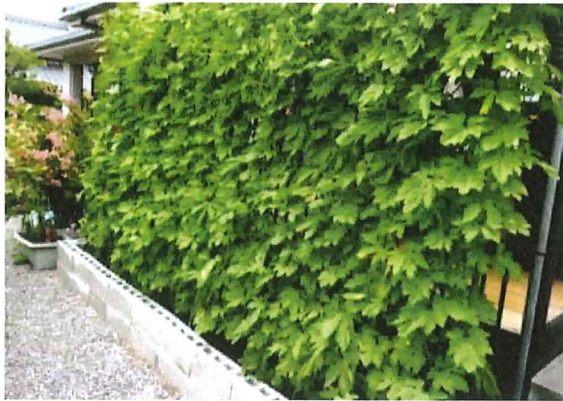
南向きのベランダ前に一面に生い茂りました。