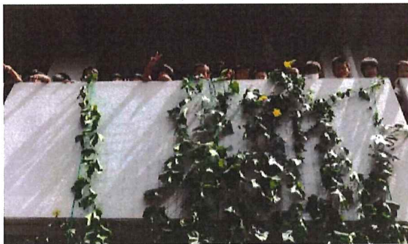
4年生が育てたヘチマ。2回のベランダま でのびたので、4年生と1,2,3年生でお祝 いをしてパチリ!!