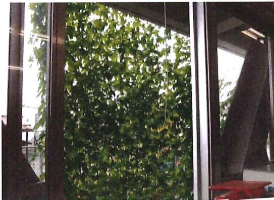
職員室から見るゴーヤ。