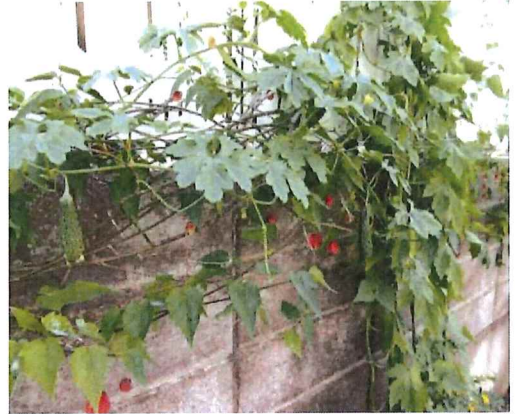
アブチロンの赤、ゴーヤの花の黄色、葉や実の緑とコントラストがきれいです。