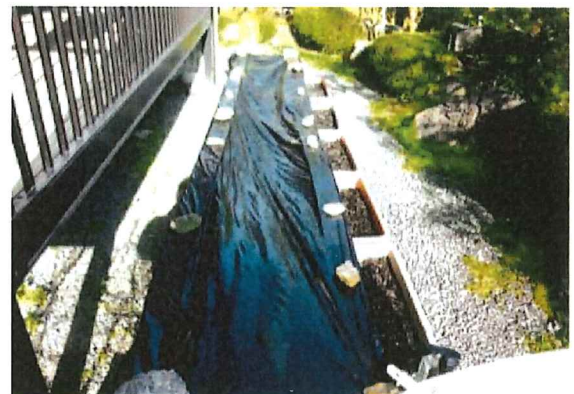
古い土、苦土石灰、腐葉土、牛糞を混ぜ合わせ、ビニールを掛けて発酵させました。