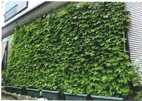
窓一面に生い茂りました。