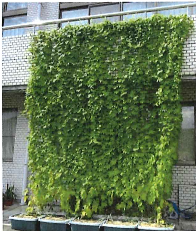
窓に差し込む陽射しもシャットアウト。