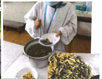
夏休み…早く食べてほしい…と言ってい るようなゴーヤ。 ついにゴーヤチップスになりました。