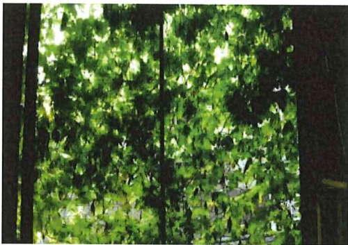
午後からの来客時、雨戸を開けて見える風景は何とも言えない感無量です。