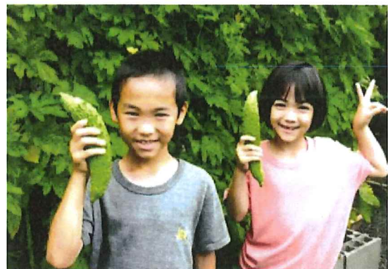
遊びに来た友人の子供が収穫したゴーヤを手に記念撮影。