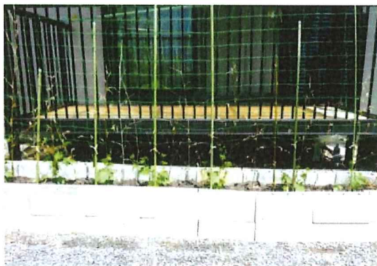
筐を添え木代わりにして、つるをネットまで誘導しました。