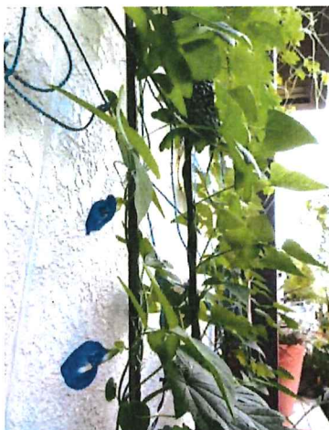
知人からいただいたバタフライピーの種を蒔いてみたら、初めて花が咲きました。