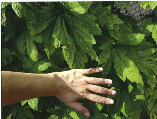
掌より大きく育ったゴーヤの葉！