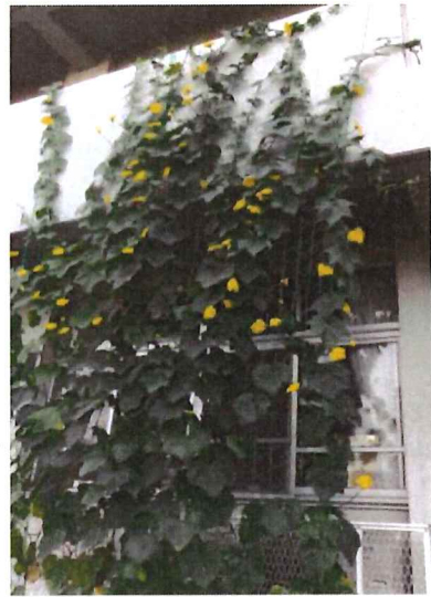
お花、め花が咲き、緑と黄色が目によさ しいです（ヘチマ）