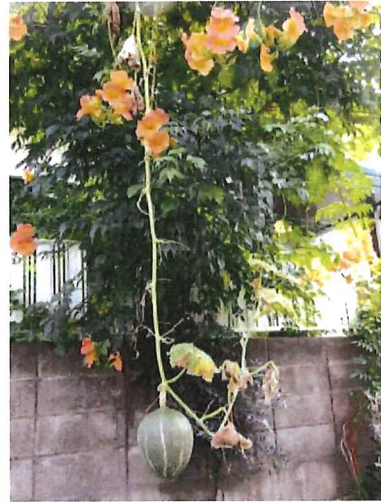
EMの土から発芽して、ノウゼンカズラにぶら下がったかぼちゃ。多くの皆さんに楽しんでいただけました。