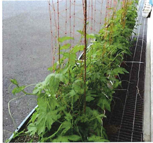
6月10日、ゴーヤが少し大きくなり、ネットを張りました。