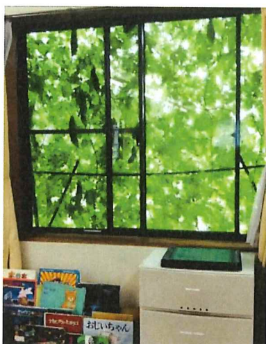
室内から見たゴーヤカーテン