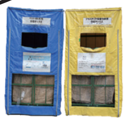
▲廃止される拠点回収ボックス

また、市内9か所の公共施設に設置しているペットボトルとプラスチック容器包装類の拠点回収ボックスの利用は6月29日まで。6月30日に撤去します。