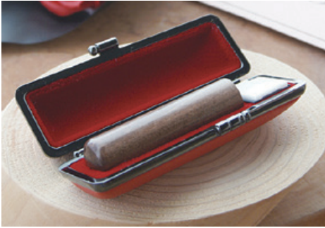
【提供】榮明印房(浜町7-8、☎63・5663)