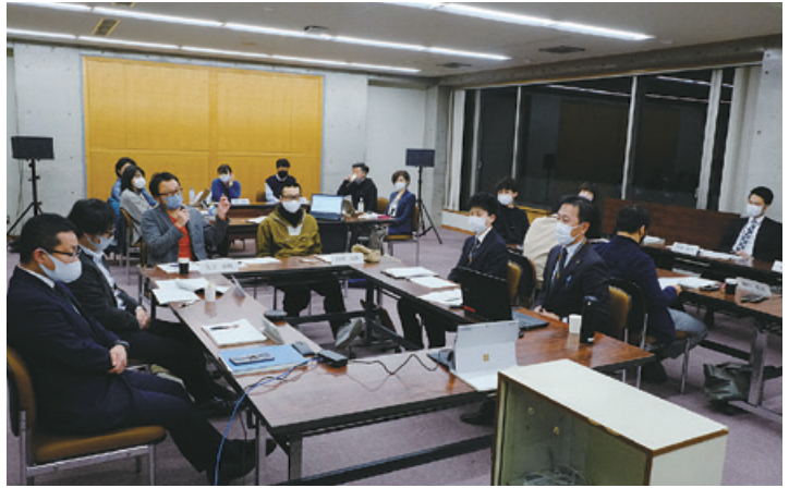
▲ブランディング会議