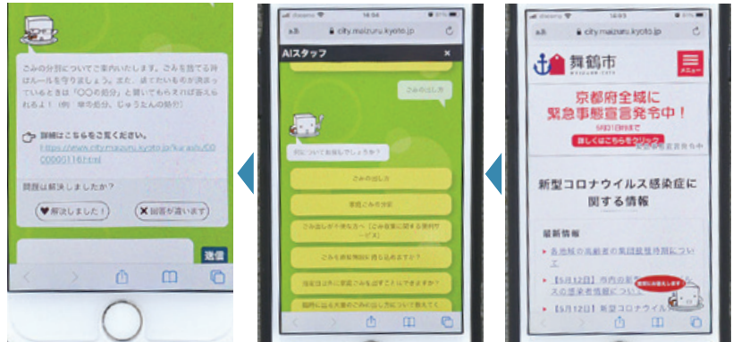
▲チャットボットの流れ(左の「解決しましたか」の結果から学習し回答を提示)