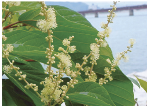
アカメガシワ (トウダイグサ科)

宮城県、秋田県以南の山野に生える落葉高木。樹皮は灰褐色を帯び、縦に浅い割れ目がある。葉は互生し、長い柄があり長さ15〜20cmの広卵形で先は尖る。若い木では浅く3裂するものが多い。若葉は紅色を帯びる。夏、枝の先に長い花序を付け、黄色の小花をたくさん付ける。名前の由来は、若葉が紅色を帯び、カシワの葉と同様に食物を乗せるのに使ったことによる。別名「サイバ(五葉葉)・サイモリバ(采盛葉)とも呼ばれる。雌雄異株。