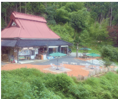
▲豊かな自然に囲まれたロケーション