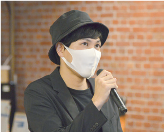
▲自分の思いを語るブランディングメンバー