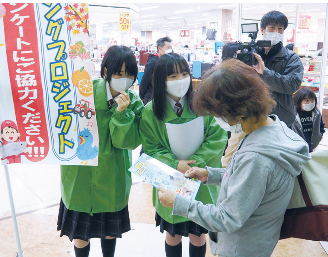
▲らぼーで行ったシティブランディング街頭アンケートは東舞鶴高校の生徒も参加