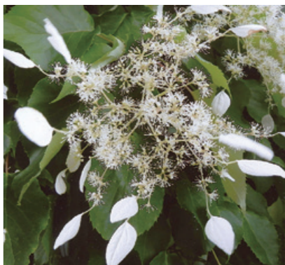
イワガラミ (アジサイ科)

北海道から九州の山地に生え、茎から気根を出し、若や木によじ登る落葉つる性木本。大きなものでは幹の太さが5センチを超え、樹皮は厚く、葉は対生し、長さ5〜12センチの広卵形で先は尖り、縁に鋭い鋸歯がある。夏、枝先の大きな花序にたくさん小さな両性花と周りを長さ2〜3センチの白い装飾花を取り囲む。名前の由来は、気根を出し若や木にからみつくことから。同じころに咲くツルアジサイは装飾花が4枚、イワガラミは装飾花が1枚なので区別がつく。