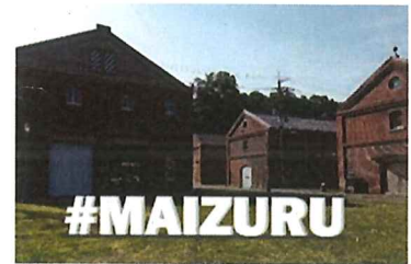
▲記念モニュメント(イメージ)