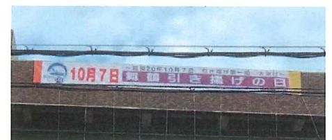
▲横断幕掲出(昨年度実施)