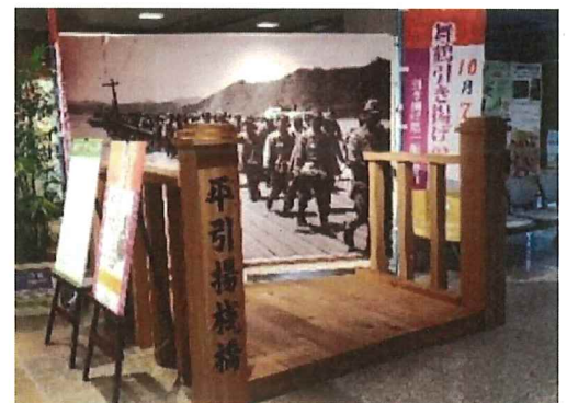
▲昨年度までの展示の様子