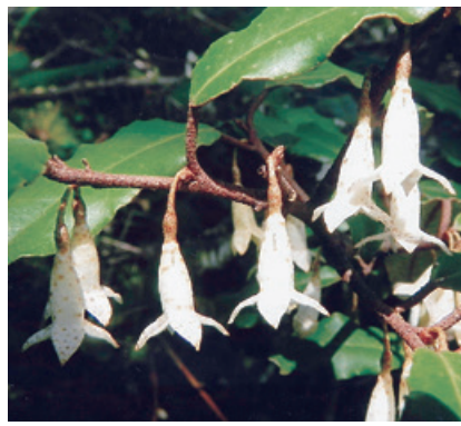
ナワシログミ (グミ科)