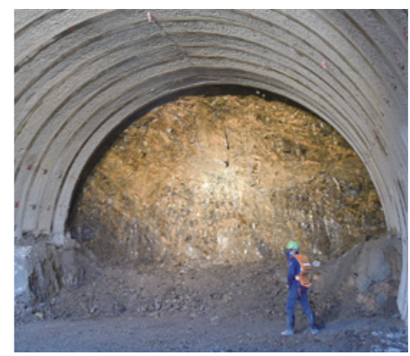
▲掘削している地質の状況

掘削箇所は、掘削箇所（北向き）のトンネルは、掘削箇所の地質状況から、火薬を用いた一般的な掘削は行わず、機械掘削で掘り進め、年内には貫通する予定です。