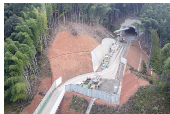
▲境谷トンネル坑口付近

境谷トンネルとは、西舞鶴道路の境谷と菅浦台をつなぐトンネルです。上り線（北向き）138メートルと下り線（南向き）221メートルの2本のトンネルを予定しています。そのうち、着手し