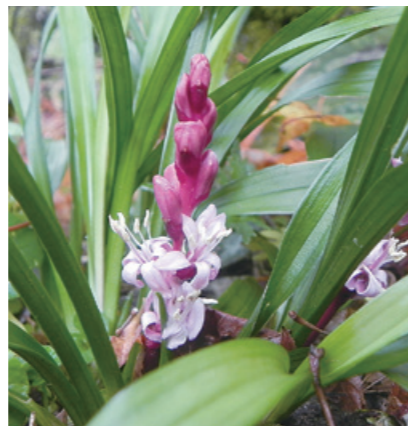
キチジョウソウ (ユリ科)