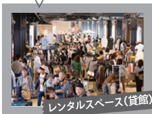
レンタルスペース(貸館)