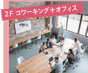
2F コワーキング+オフィス