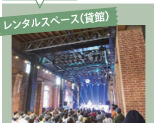
レンタルスペース(貸館)