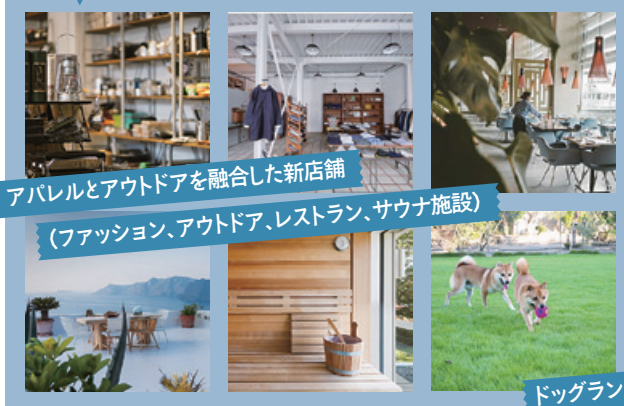
アパレルとアウトドアを融合した新店舗 (ファッション、アウトドア、レストラン、サウナ施設)