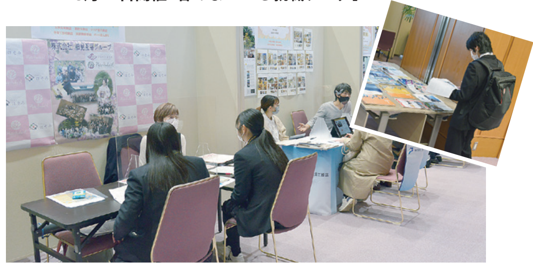
▲「春のまいづる就職フェア」に参加していた学生たちの様子