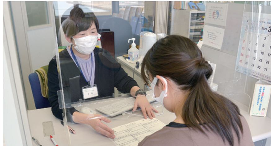
▲ハローワークの職員が職業紹介をしている様子

◆「ジョブサポート」で利用できるサービス ◆ハローワーク舞鶴による職業紹介： 就きたい職業について相談を受けて実際に仕事を紹介します ◆京都ジョブパークなどによる就職相談・セミナー：効果的な履歴書の書き方や話し方、敬語の使い方などのセミナー、個別就職相談を行っています