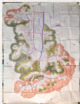
「第十五大区丹後国加佐郡五ノ小区余部上村見取図」 明治6(1873)年の余部上村の絵図。現在と比べると鎮守府開庁で大きく変化したことがわかる

余部下村の庄屋を務めた布川家に伝えられた近世や近現代などの計3,372点の文書群で、鎮守府開設にまつわる当時の資料が多数残されています。