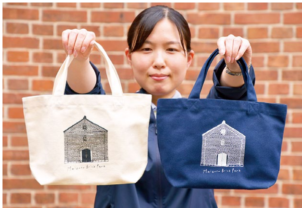
※どちらか一つをプレゼント。色は選べません