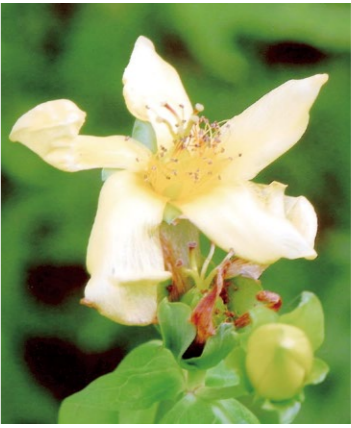
トモイソウ (オトギリソウ科)

山地の日当たりの良い草地に生える多年草。茎は直立し、高さ60〜90センチで上部で枝分かれする。葉は披針形で薄く対生し、葉柄はなく茎を抱き、長さは4〜8センチで先は尖り全縁透かして見ると明るく細かい点がまばらにある。夏、茎の先に5センチ程の黄色の花が数個次々と開く。花は日を受けて開き一日でしぼむ。花はともえ形にねじれ、これが和名の由来。たくさん雄しべは5つの束になっている。舞鶴では最近特に少なくなっている。京都府絶滅寸前種。