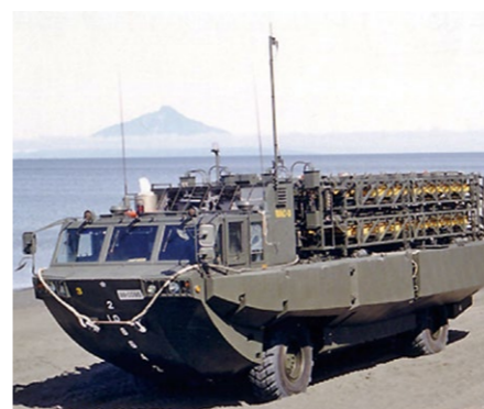
▲陸上自衛隊水陸両用車

たものが稼働しているのを見るとやりがいを感じます。 職場環境は、ミリタリー好きが多く共通の趣味を持っている人が多いので、業務中もコミュニケーションは良好で良い雰囲気です。東京に支社があり、経験のため2年程転動する可能性はありますが基本的に異動の希望は聞いてもらえず、残業も少なく定時に終われることが多いです。設計として1つの製品に携わるので、仕事の繁閑を想定しやすく、自分で仕事を管理しながら有給休暇も自分の好きなタイミングで取っています(※)。 今は先輩の下について設計に携わっていますが、今後は学んだことを生かし「私がこの製品の主担当です」と胸を張って言えるような製品を製造したいです。 ※従業員の有給休暇の平均取得日数は約15.5日。月の残業時間は平均約15時間。フレックス制を導入しており、柔軟な働き方ができ、各種制度も整備。給与、待遇面は大手企業と同程度