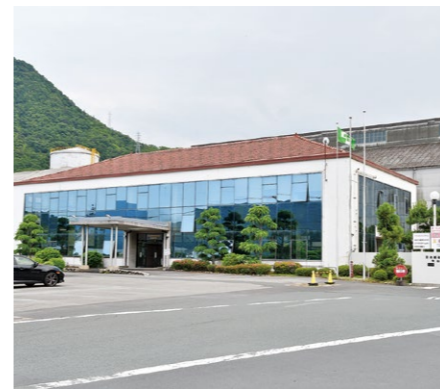
▲日本板硝子㈱舞鶴事業所

が出た時には達成感や充実感があります。配属先の希望もできるだけ聞いてくれて、有給休暇もしっかり取得できます。新婚旅行の際は有給休暇とは別で休みもいただきましたし、制度が整った働きやすい職場だと思います。給料面でも前職と比較するとかなり増えましたし、半導体不足などで車の生産が一時停止し、仕事が休みになったこともありましたが、休業補償が手厚く給料は大きく減少しませんでした。前の職場では考えられないことで、舞鶴に帰り板硝子に就職して良かったです(※)。 板硝子は世界的な会社です。自分や家族の人生を安心して預け、働ける会社だと思います。舞鶴で働くなら、またUターンを考えている人がいるなら板硝子にチャレンジして後悔はないと思います。 ※従業員の有給休暇の平均取得日数は約17日。月の残業時間は平均約10時間。有給休暇に加えて育児や介護のための休暇などを整備