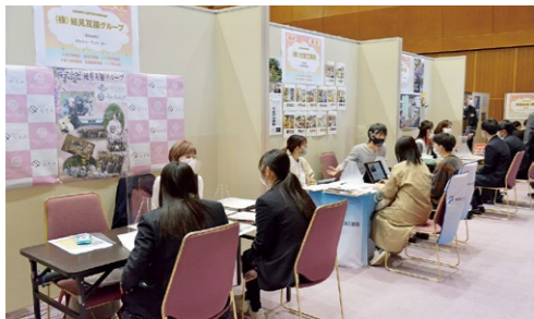
▲春のまいづる就職フェアの様子

3月12日に実施した「春のまいづる就職フェア」の結果がまとまりました。今回は過去4年平均の2.2倍になる195人も参加があり、22件の就職内定につながりました。 昨年度と比較し、学生参加者の内訳は大学2年生と高校生が増加、一般参加者は若年層、転職検討者、遠方からの参加者が増加。1人当たりの平均訪問ブース数は7.4ブースと、会場は活気に包まれ、出展者、参加者共に満足度の高いものとなりました。