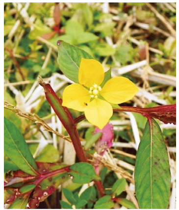
ヒレタゴボウ (アカバナ科)

アメリカ原産で水田や湿地に生える帰化植物。茎は3〜4稜(角張り)がありよく分岐し、高さ50〜100cm。葉は互生し、ほとんど無柄で長さ5〜12cm、幅1.5〜3cmの披針形で全縁で無毛。茎や葉は暗紫色を帯びることがある。夏から秋にかけて、葉腋に径3cm程の黄色の4弁花を付ける。名前の由来は、タゴボウ(チョウジタデの別名)に似て茎にひれがあることから。稲刈りが済んだ田でたまに見かけることがある。別名、アメリカカミズキンバイ。