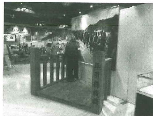
▲引揚栈橋（模型）（舞鶴市資料）