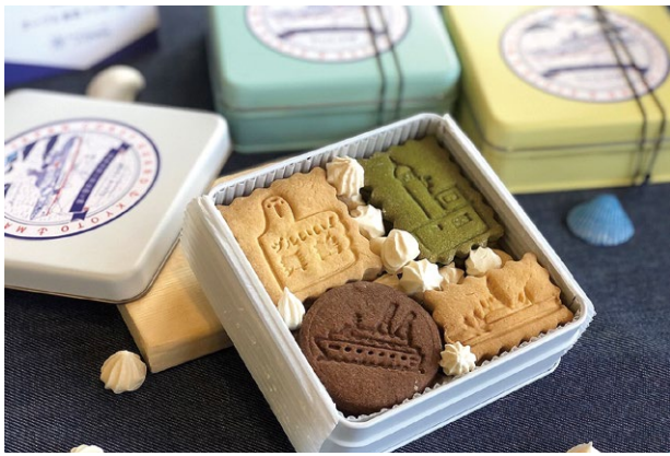
※缶の色は選べません