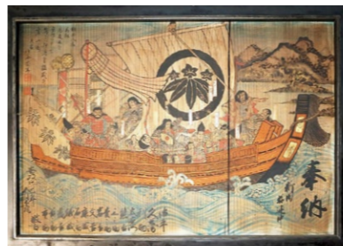
ちんげいためともとかいず ▲鎮西為朝渡海図

【所有者】宗教学法人水無月神社 吉原地区の氏神である水無月神社に奉納された江戸時代から大正時代の絵馬群。漁業者から奉納された絵馬もあり、漁師町の景観を今に残す吉原地区の江戸時代からの信仰の