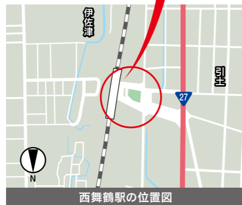
西舞鶴駅の位置図