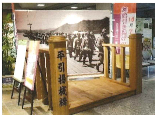
▲昨年度までの展示の様子