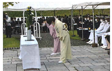
△式典での献花の様子

「舞鶴引き揚げの日」である10月7日(土)に平和祈念式典と食の体験イベント等を舞鶴引揚記念公園で開催する予定です。