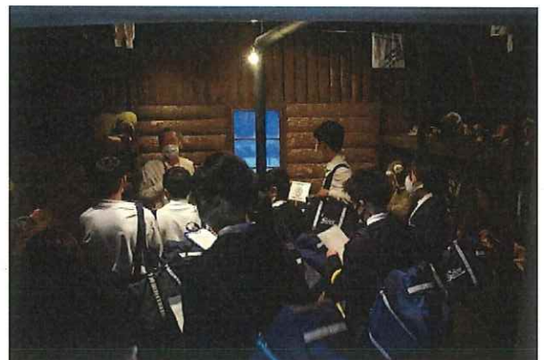
▲語り部の活動の様子