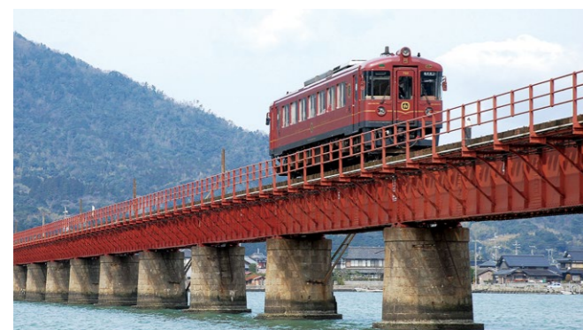
▲運行している京都丹後鉄道