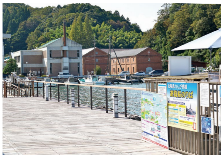
▲改修された遊覧船乗り場