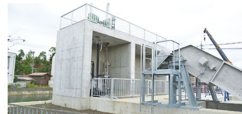
▲整備された大手ポンプ場