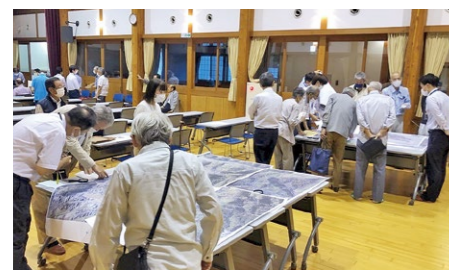
▲地元住民と森林の地形図を見ながら協議