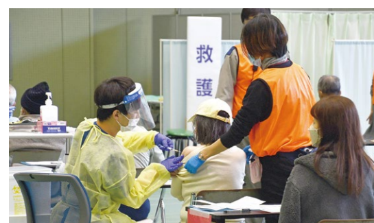
▲昨年実施したワクチン接種