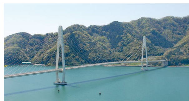
▲定期的に点検・修繕が実施されているクレーンブリッジ