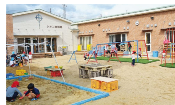
▲改修された認定こども園で遊ぶ園児たち

子育て環境を充実させるため「幼保連携型認定こども園」への移行を目指す私立幼稚園(2園)に対して必要な施設改修費を支援