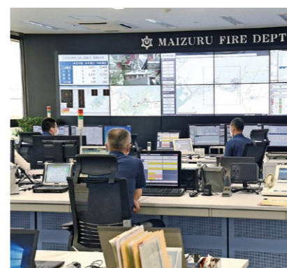
▲舞鶴市消防本部の消防指令センター

将来にわたって持続可能な消防指令体制を維持するため、国が示す「市町村の消防の連携・協力の基本指針」に基づき、京都市中・北部地域の6消防本部の指令業務を消防指令センター(福知山市)に集約し、共同運用するための整備を実施