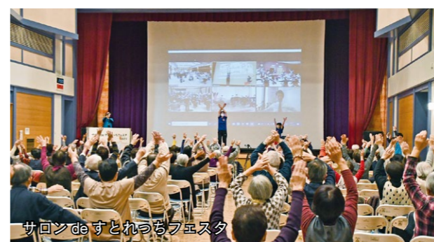
サロンdeすれつちフェスタ

決める」ことから始めることをお勧めします。アンケートの結果から、独居の人でも社会参加している人はフレイルに該当する人が少ないということも分かりました。社会参加といっても、大げさにとらえる必要はありません。買い物、通院、散歩など外出する機会を持ちましょう。人付き合いが苦手でも「決まった時間にスーパーに行く」などの日課があれば、顔見知りができるかもしれ