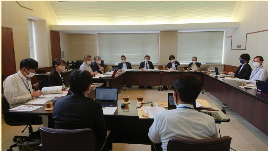
市原市職員から説明を受ける