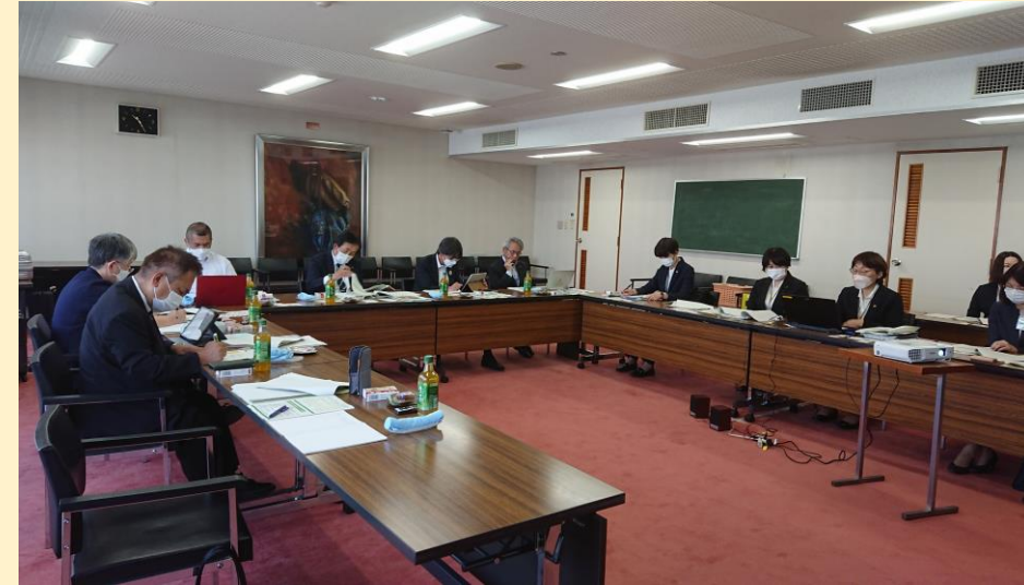
坂戸市職員から説明を受ける