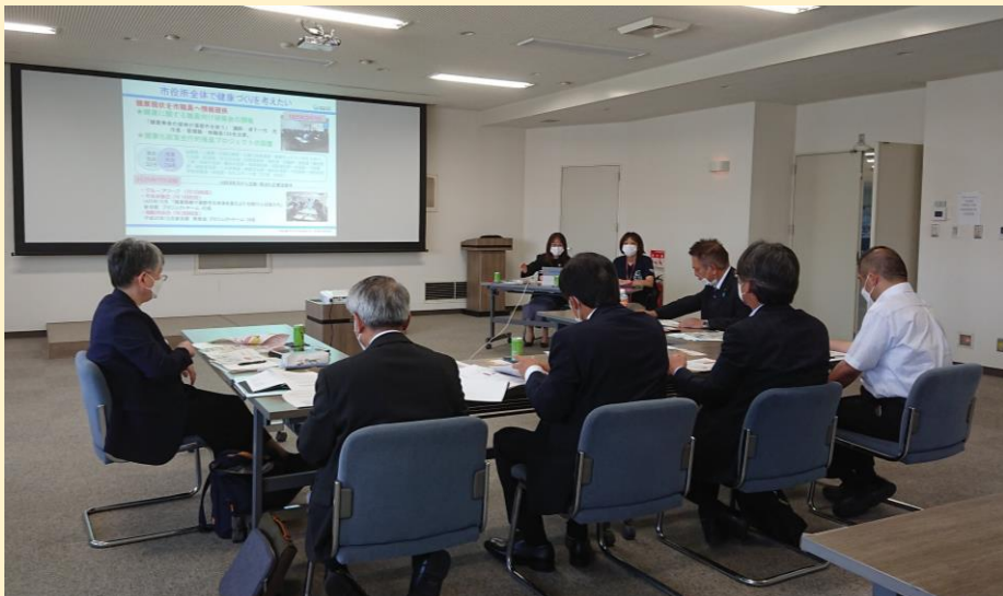
蒲郡市職員から説明を受ける