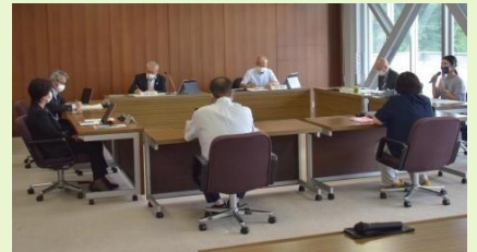
▲ FM放送に係る意見交換会