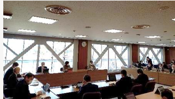
委員会における質疑応答