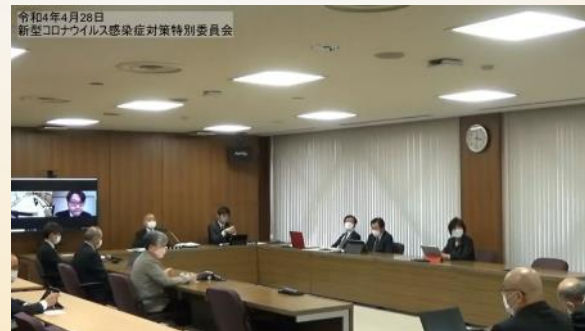
委員会のオンライン開催