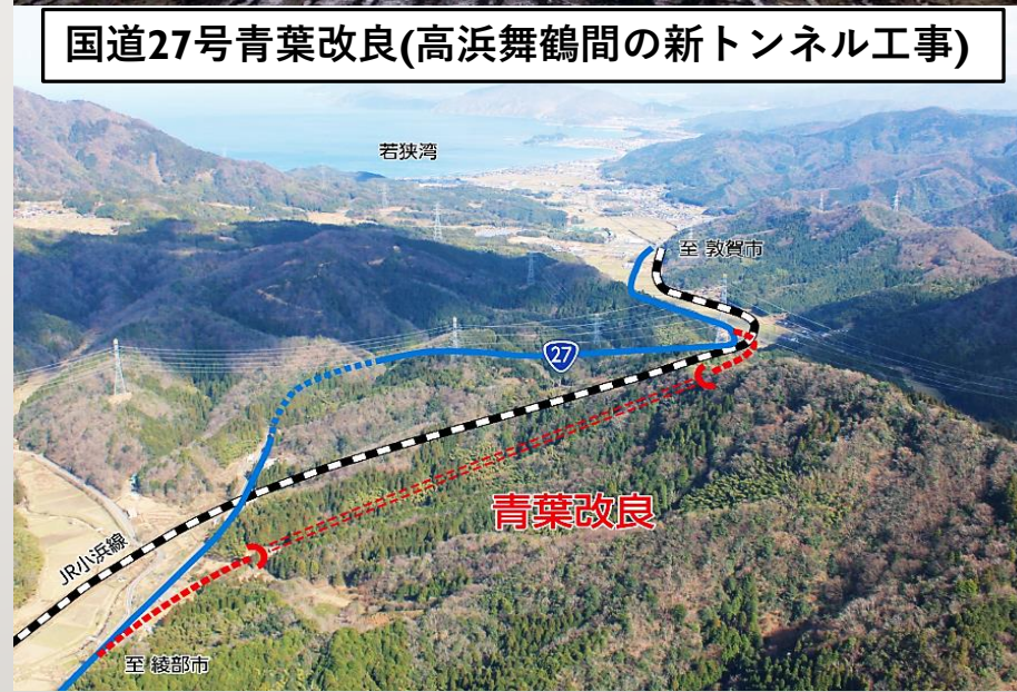
国道27号青葉改良(高浜舞鶴間の新トンネル工事)