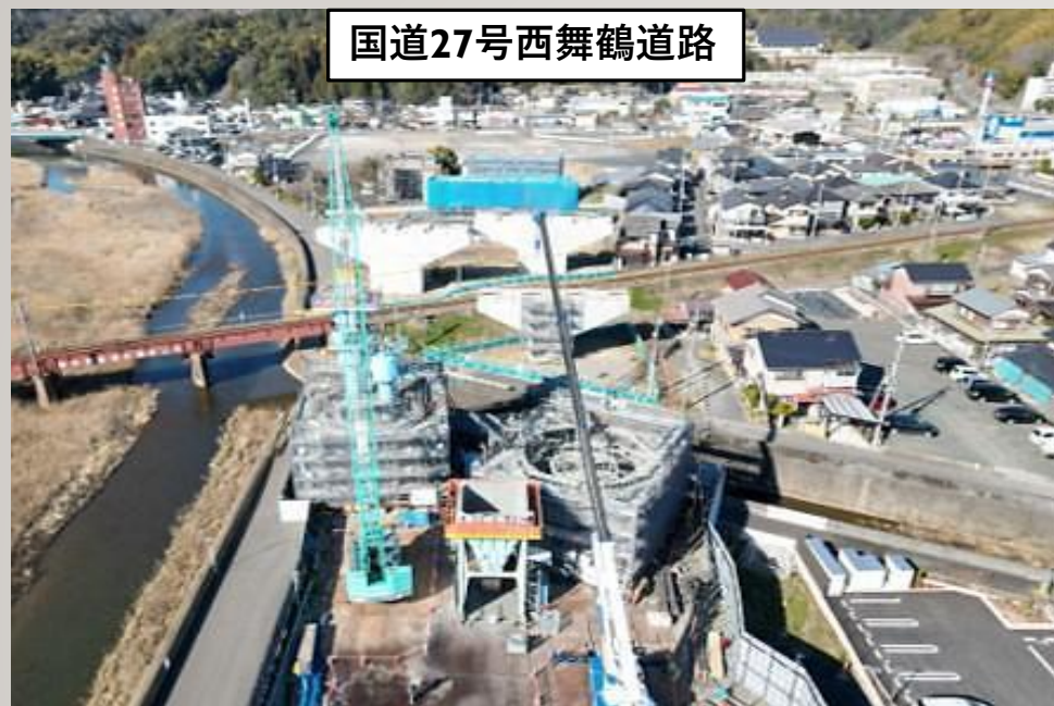
国道27号西舞鶴道路