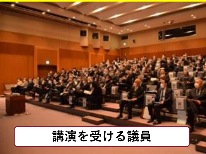
講演を受ける議員