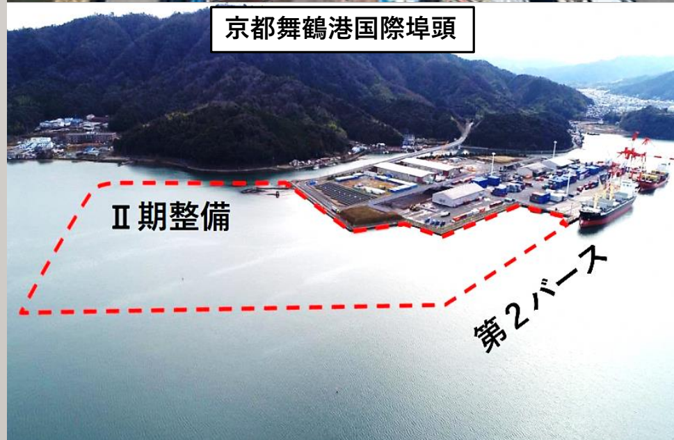
京都舞鶴港国際埠頭