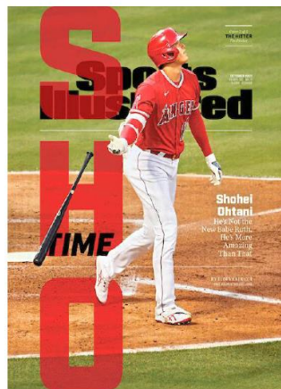
政策立案、政策提言