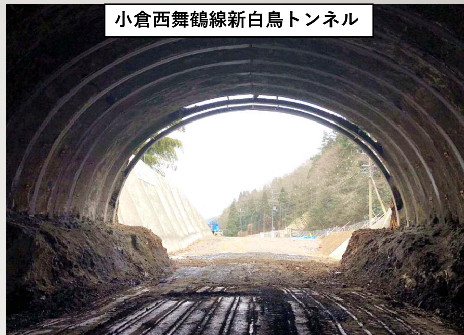
小倉西舞鶴線新白鳥トンネル